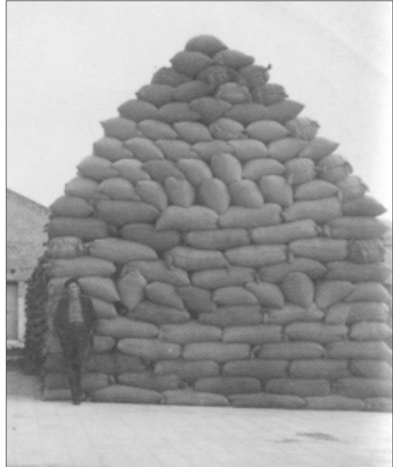
Pilera de sacs d'arròs feta pels camàlics.

Els equips, formats per 4 persones de les quals com a mínim una serà dona, hauran de construir una pilera amb els sacs igual que la inicial, recorrent una distància de 25 metres. L'equip següent haurà de fer el mateix traslladant els sacs a la posició inicial. Per a la distribució dels punts es comptarà el temps que trigui cada equip en fer el trasllat i muntatge de la seva pila. Els sacs seran de 50 kg. per als participants masculins i de 30 kg. per a les participants femenines, i tots tindran la mateixa mida i estaran plens d'arròs i/o pallús fins aconseguir el pesos corresponents.