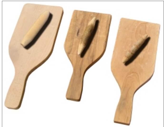
Pales i bèlits

El material que es necessitava era una pala semblant a la de ping-pong, i amb unes mides properes als 30x15 cm.; i un bèlit, que és un bastonet d'uns 10 ò 12 cm. de llarg i amb els dos extrems acabats en punta.